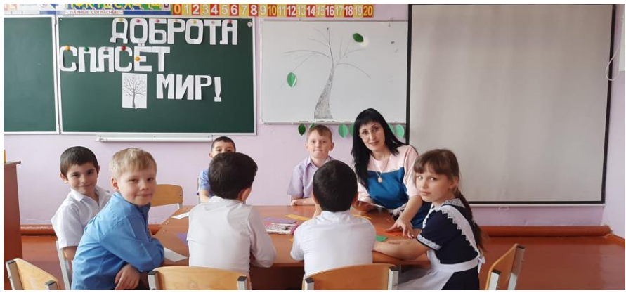
5. Обучающиеся 1-4 классов и дети с ОВЗ приняли активное участие в творческом конкурсе рисунков «мир один на всех».